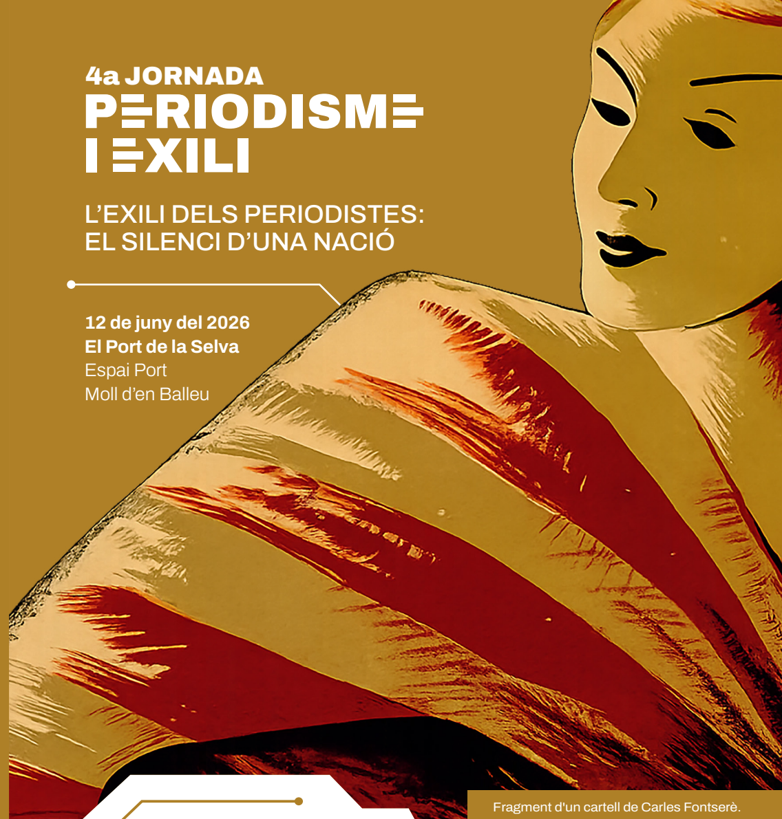
Fragment d'un cartell de Carles Fontserè.

12 de juny del 2026 El Port de la Selva Espai Port Moll d'en Balleu